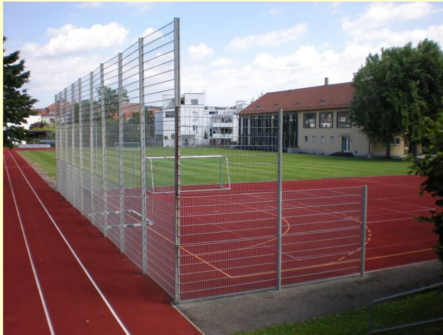
Sportgelände und Turnhalle